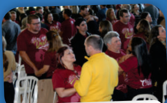
2º RETIRO PARA CASAIS