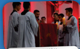
NOVENA E VIGÍLIA DA SOLENIDADE DE PENTECOSTES