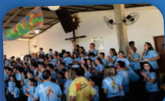
3º ACAMPAMENTO PARA FAMILIAS