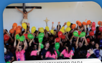
4º ACAMPAMENTO PARA NAMORADOS