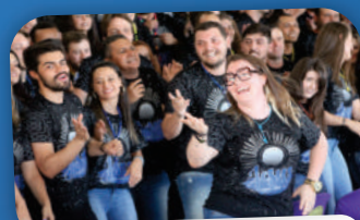
12º ACAMPAMENTO JUVENIL