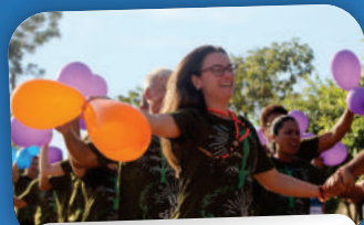
23º ACAMPAMENTO SENIOR