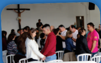
1º RETIRO PARA CASAIS