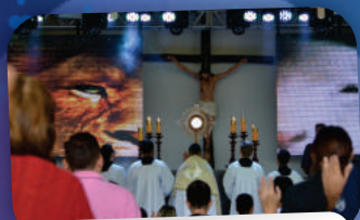
6ª EDIÇÃO DO REINFLAMA EMANUEL