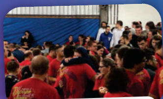
11º ACAMPAMENTO PARA CASAIS