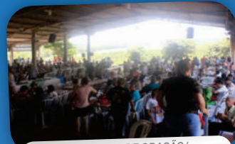
CAMPANHA DE ORAÇÃO/ CONFRATERNIZAÇÃO E LEILÃO DE GADO