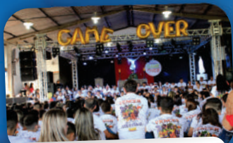
1º ACAMPAMENTO DE CARNAVAL GAME OVER