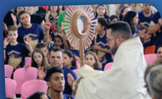
18º ACAMPAMENTO MIRIM