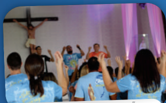
2º RETIRO DE CONSAGRAÇÃO MARIANA