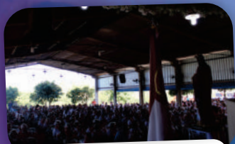
ENCONTRO DIOCESANO DO APOSTOLADO DA ORAÇÃO