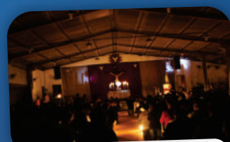
ENCONTROS DE CURA E LIBERTAÇÃO COM ROBERTO TANNUS