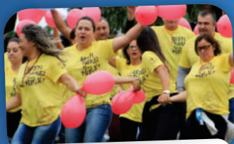
24º ACAMPAMENTO SENIOR