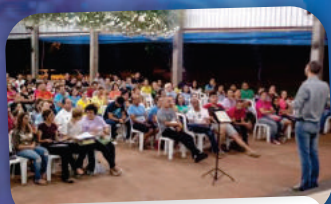
INÍCIO DA ESCOLA DE FORMAÇÃO BÍBLICA