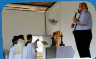
ACAMPAMENTO DE ORAÇÃO COM OPERÁRIOS DA MESSE