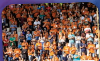
12ª EDIÇÃO DO EFFETA