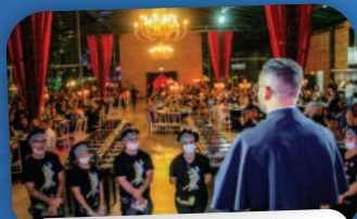
3º JANTAR ITALIANO DA COMUNIDADE CATÓLICA EMANUEL